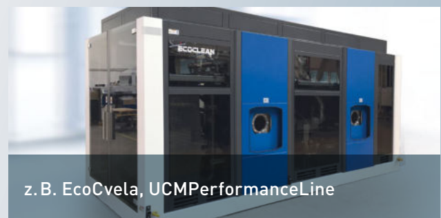
z. B. EcoCvela, UCMPerformanceLine