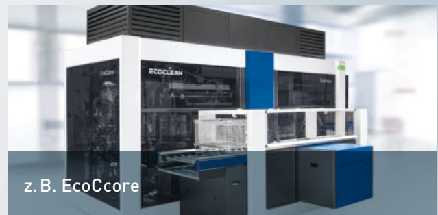
z. B. EcoCcore