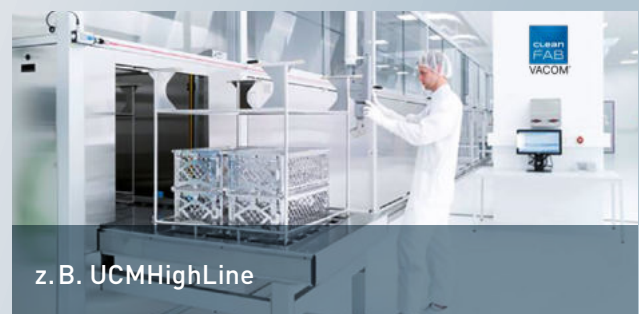
z. B. UCMHighLine